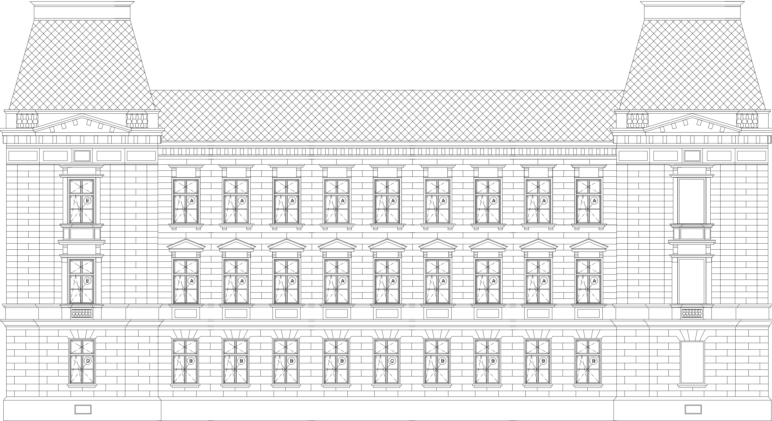
I. ETAPA / FASÁDA 5